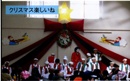
クリスマス楽しいね