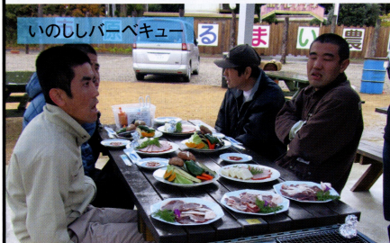
いのししバーベキュー