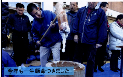
今年も一生懸命つきました

「ヨイショー」と大きな掛け声で、今年も餅つき大会を行いました。「僕もお餅をつきたい」「私は鏡もちを作りたい」と、それぞれが思い思いに取り組み、最後はお楽しみのお汁粉を食べて、良い年の瀬を迎えました。