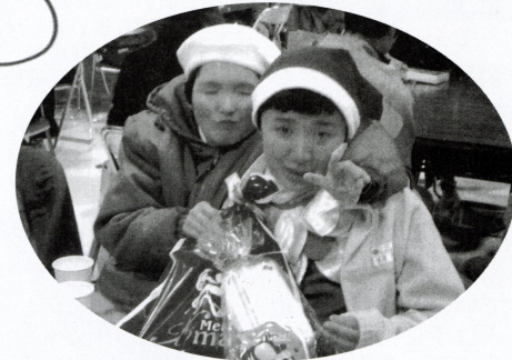
▲プレゼントに大満足!