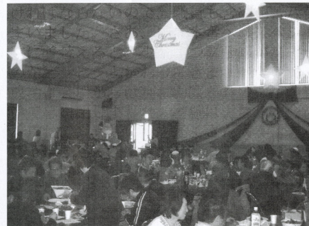
▲今年は星に願いを込めました!

利用者代表のあいさつ、乾杯と同時にみんなが待っていた楽しい食事が始まりました。メニューはハンバーガーやスパゲッティなど好きなものがたくさん並び、みんな夢中になっていました。職員の余興では、ハンドベルやアルゴ