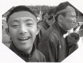
▲手をつなぐスポーツのつどい

今年もフライングディスク大会・市原市スポーツ大会・手をつなぐスポーツのつどいといろいろなスポーツ大会に参加してきました。ジャージに鉢巻きの凛々しい姿に太陽に負けないくらいのまぶしい笑顔で体をめいっぱい動かしてきました。どの大会も天候に恵まれ、ぬけるような空の下、協力してリレーをたり、跳び箱をジャンプしたり、ディスクを遠くへ飛ばしたりとハッスルしてきました。