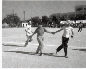
▲市原市スポーツ大会