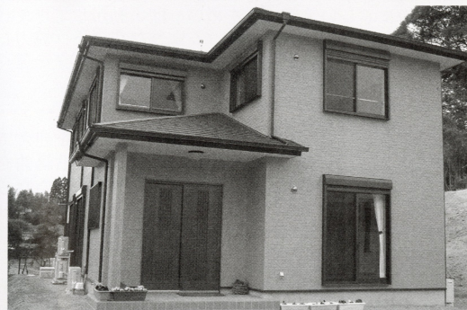
▲グループホーム「希望の家きちさわ」です。

グループホーム「希望の家きちさわ」が4月からスタートすることとなりました。運営にあたっては日中活動やケアの確保・経済的支援・相談支援・地域資源活用など生活全般におけるバックアップを当法人で行っていきます。地域移行と称して、小型化された施設ケアにおさまることなく、無限の可能性を秘めている場として運営を図っていきたくと考えています。ホーム内、また地域の皆様や関係機関と連携しながら、地域と共に支えあっていけるようなグループホームに育っていきたくと思っています。