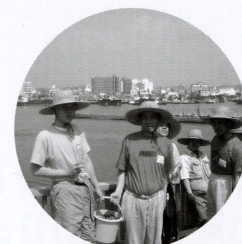
▲バケツにいっぱい！

ろ、とにかくたくさん採れて、みんな大喜び！こんなに採れたのは初めてで、木更津大橋をうれしい悲鳴をあげながら、渡って帰りました。採ったあざりは味噌汁にして味わい、これまたおいしい！と、みんな大満足でした。