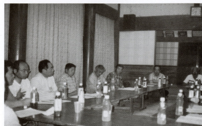
▲吉沢町会のボランティアの方との話し合い

れない様子でした。今年はやきそばやた焼きの店出、地域の方との交流、また、抽選会もあって、例年以上に楽しみにしていた人が多かったのではないのでしょうか。この後学園では、内輪でささやかな交流会を開きました。この日のために練習をしてきた利用者の太鼓に合わせて、炭坑節や市原