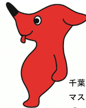
千葉県 マスコットキャラクター 「チーバくん」