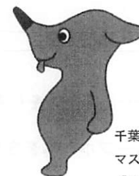
千葉県 マスコットキャラクター 「チーバくん」