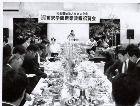
社会福祉法人ききょう会 祝吉沢学園新築披露祝賀会