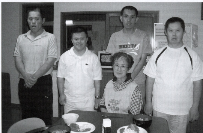
▲世話人さんと共に楽しく過ごしています

4月から新しい生活が始まりましたが、4月当初は、急に4人という少人数の生活になって、寂しくて何度も電話をしてきた入居者の方もいましたが、今ではホームの生活に慣れ、自分の部屋で音楽を聴いたり、DVDを見たりと余暇を楽しめるようになってきました。月に1回は歩いて本屋さんや日用品を買いに出掛けたりしています。7月には希望の家「きちさわ」の入居者さんたちと一緒にバーベキューを行ったり、八坂祭りへ出かけたりして交流もしています。夕食時には世話人さんと1日の出来事を話しながら楽しい団欒をすごしています。