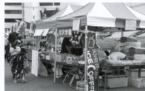
▲たくさんのお客様に来店していただきました