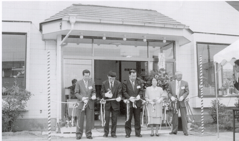
▲9月29日、テープカットで福祉ショップ「きちさわ」がオープンしました。