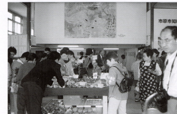
▲オープン当日は、たくさんの方が来店して下さいました。

紹介や展示即売もしております。そして、店内奥には「交流広場」と称し、どなたでもご自由にご利用できるスペースがあり、壁には現在、吉沢学園の利用者が描いた絵を展示し、ちょっとしたギャラリーとなっています。是非、みなさん一度遊びに来て下さい。