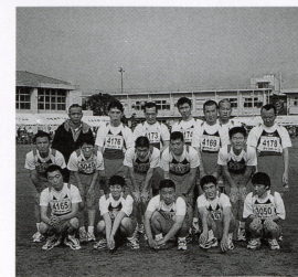
▲今回参加した選手の皆さんです

平成12年1月8日、第26回市原シティマラソンが開催され、学園からも男子13名、女子3名が参加しました。練習は12月より朝の作業時間前や、帰宅中の正月休みの間にも選手は集まって練習を続けるなど、皆頑張ってきました。大会は距離等でグループ分けされており、選手は中学生男子3km（約180名）に参加しました。当日は体調を崩すことなく全員完走することができました。年々参加者が増え、レベルが上がっていますが、練習以上の力を出すことができ嬉しく思っています。応援団の小旗を振っての声援ありがとうございました。