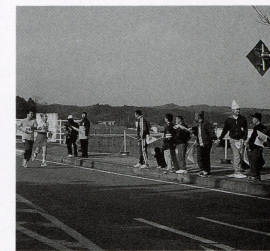
▲応援団の声援は励みになります