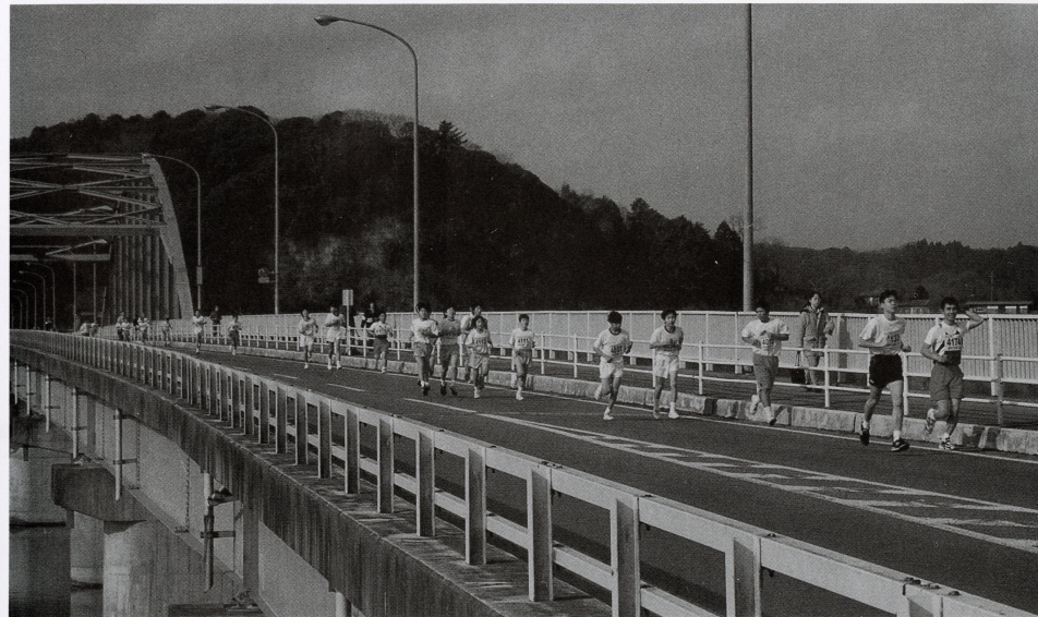
▲高滝湖にかかる加茂大橋を元気いっぱい走る選手たち