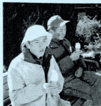
ソフトクリーム おいしいな