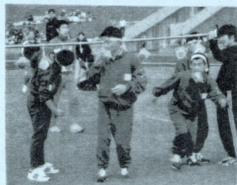
手をつなぐスポーツの集い