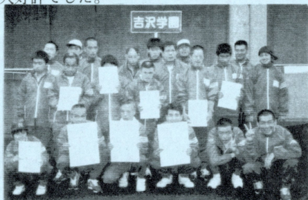
知的障害者フライングディスク大会

今年もフライングディスクなどさまざまな大会に参加し、大健闘の一年でした。朝の作業前などわずかな時間を使って、少しずつ練習を重ね、本番では皆全力で、一生懸命頑張りました。また、市原市障害者スポーツ大会では、アトラクションとして音楽隊が『キラキラ星』を発表し、大好評でした。