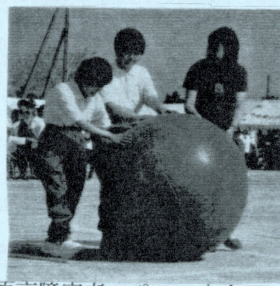
市原市障害者スポーツ大会