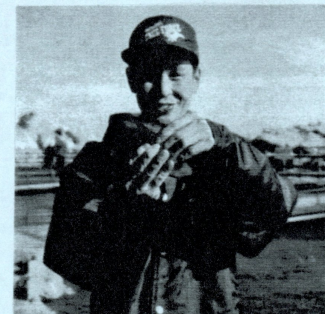
見事に釣り上げました！