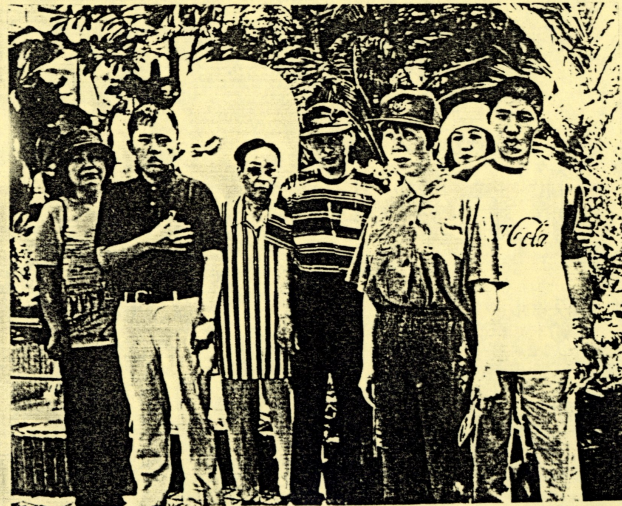
マーライオンの前で 記念写真