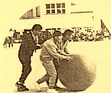
↑上手に転がせるかな？ がんばれ！↑