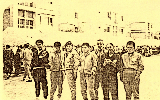
↑みんな、ポーズがきまつてるね！↑