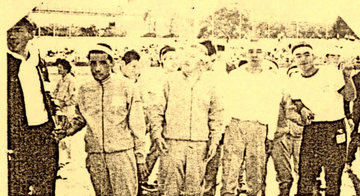
↑はちまき姿がカッコいいね↑