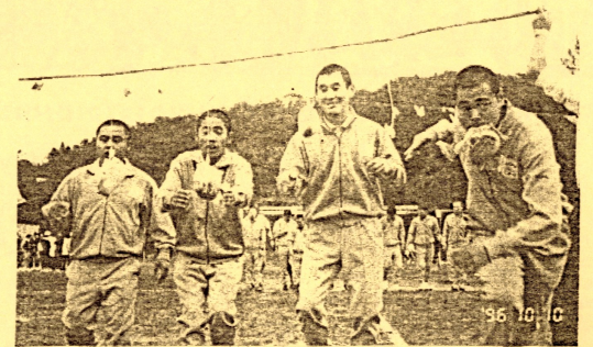
↑一等賞、めざして、全力疾走！！↑